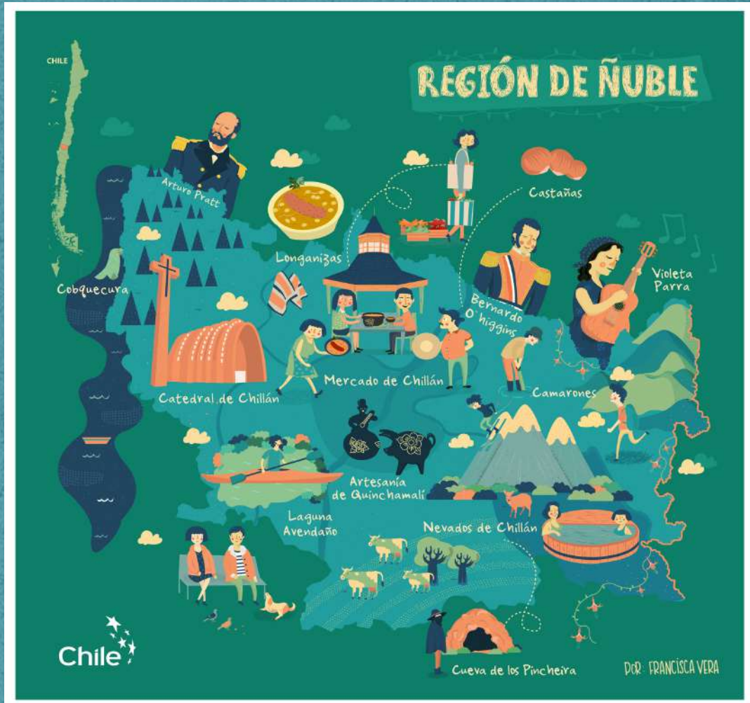
Ilustración proyecto "Chile Que Te Quiero"